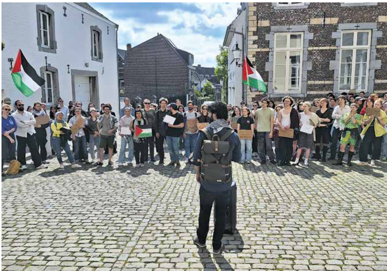
Pro-Palestijnse demonstranten voor het bestuursgebouw in mei 2024