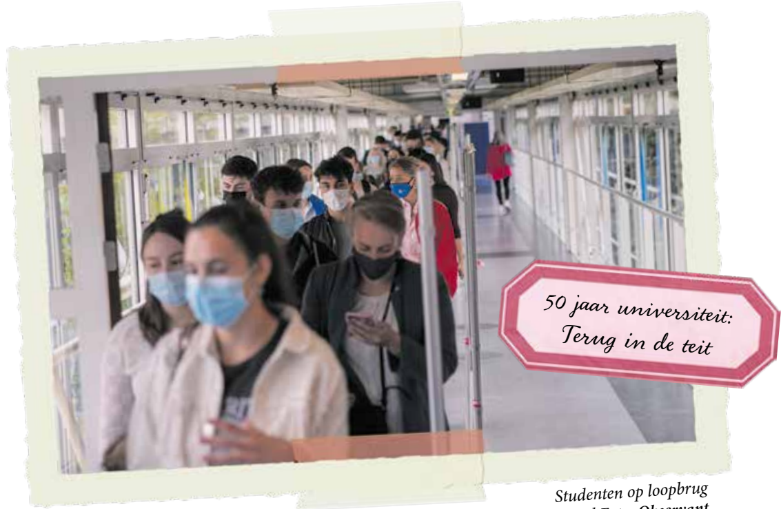
Studenten op loopbrug Universiteitssingel