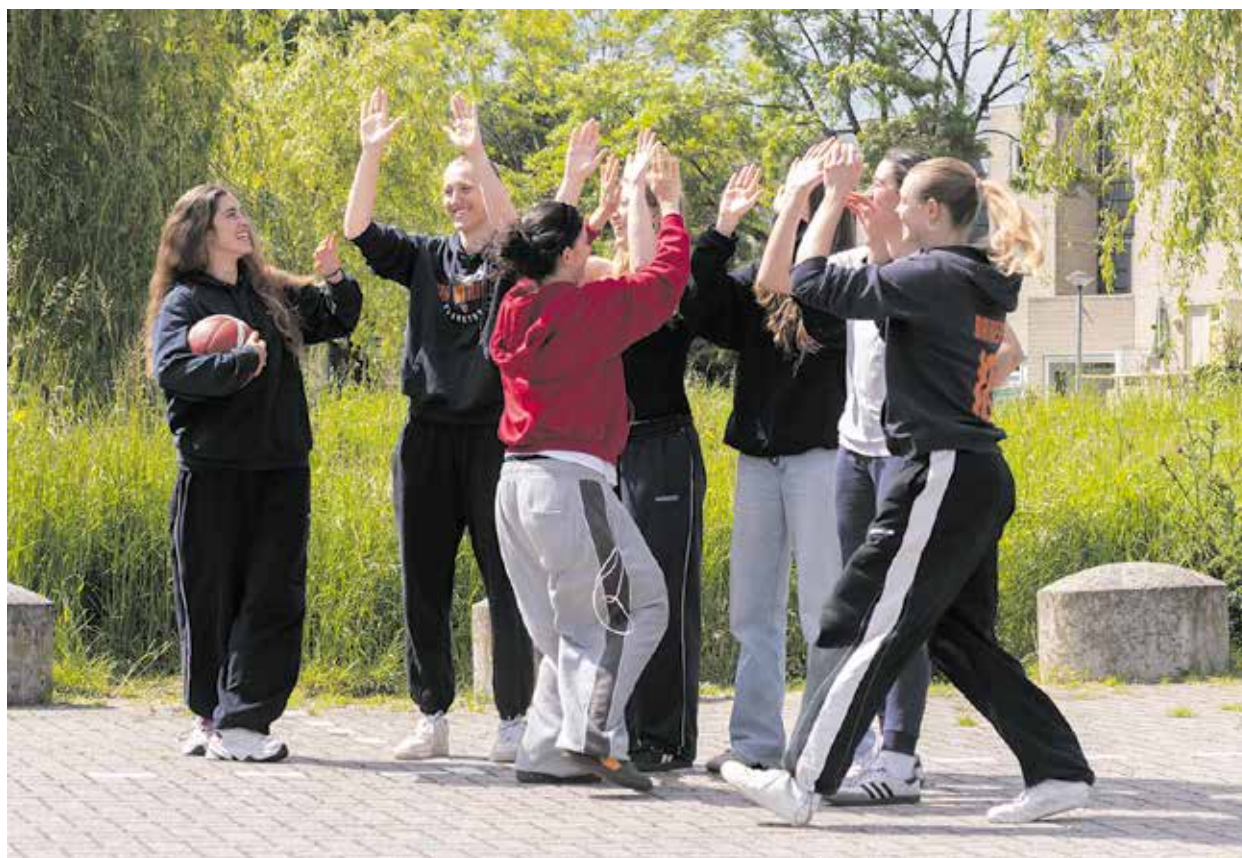
Leden van basketbalteam Maastricht Knights

De datum is met rood omcirkeld in de agenda, de selectie is gemaakt en de tenues zijn besteld. Niets staat deelname van de basketbalsters van Maastricht Knights aan de Europese Universiteitsspelen in de weg. Nou ja, bijna niets. Om met een gerust gemoed af te kunnen reizen naar Italië, is er nog wel wat geld nodig. Dat proberen ze bijeen te sprokkelen met evenementen en zelfgebakken koekjes. "Als we de sport niet zo geweldig vonden, hadden we het allang opgegeven."